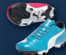
evoPOWER 4 FG Jr