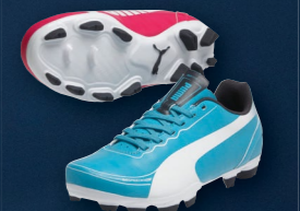
evoSPEED 5.2 FG Jr