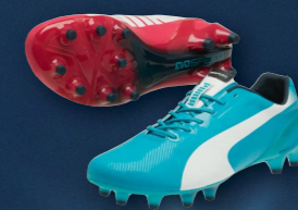
evoSPEED 1.2 Tricks FG