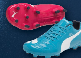
evoPOWER 3 Tricks FG