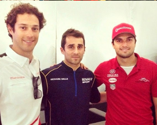
ZWEI GENERATIONEN Nelson Piquet, Alain Prost und Ayrton Senna (oben, v. l.) 1985 beim GP von Italien – 2015 fahren Sennas Neffe Bruno, Nicolas Prost und Nelson Piquet junior (unten, v. l.) in der Formel E.

Millionen zur Verfügung. Es wird langsam mehr werden. Nächstes Jahr vielleicht sieben, acht, neun Millionen. Und danach vielleicht noch mal fünfzig Prozent mehr, aber das soll dann reichen.