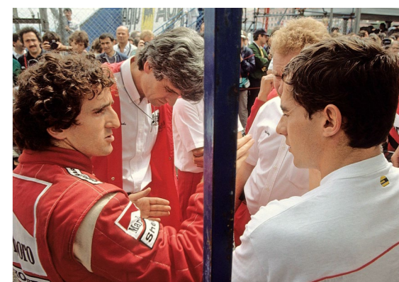
GROSSER RIVALE Mit seinem McLaren-Teamkollegen Ayrton Senna trug Prost erbitterte Kämpfe aus. Das Klima war meist frostig.

Wir können nicht zurückgehen zu dem, was wir hatten, aber wir könnten in gewisser Weise etwas lockerer sein. Die Zuschauer und die Medien sollten wieder einen besseren Zugang zu den Teams haben. Es soll kein Computergame sein. Es soll keine künstliche