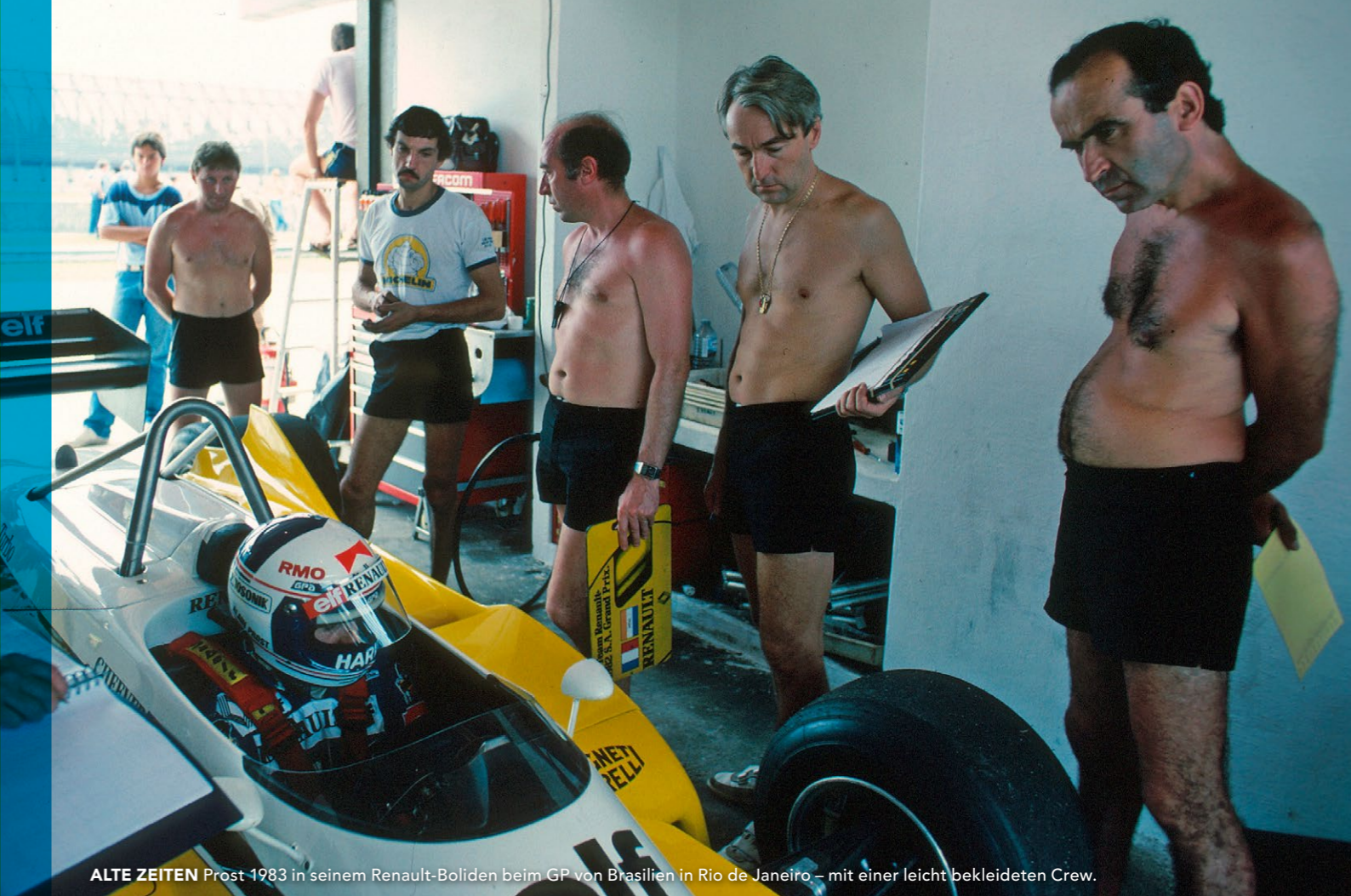
ALTE ZEITEN Prost 1983 in seinem Renault-Boliden beim GP von Brasilien in Rio de Janeiro – mit einer leicht bekleideten Crew.

Wir müssen zeigen, wir haben hier eine gute Show, gute Rennen und die besten Piloten ausserhalb der Formel 1. Wir müssen zeigen, wie die Technologie von morgen aussieht. Gleichzeitig müssen wir Kompromisse machen, um die Kosten im Rahmen zu halten. Wenn es zu schnell zu weit geht, wenn es zu teuer wird, sind wir tot, bevor wir richtig begonnen haben. Wir dürfen nicht dieselben Fehler machen, welche die Formel 1 in den letzten Jahren gemacht hat.