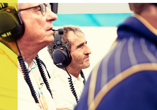
TEAMCHEF In der Box in Berlin studiert Alain Prost die Rundenzeiten seines Sohnes Nicolas und die des Schweizer Sébastien Buemi.