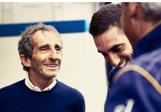
BELIEBTER CHEF Prost flachst vor dem Rennen mit Sébastien Buemi.

Ja. Heute haben die Top-Teams in der Formel 1 ein Budget zwischen 150 und 250 Millionen Euro. Wir haben hier nur drei bis vier