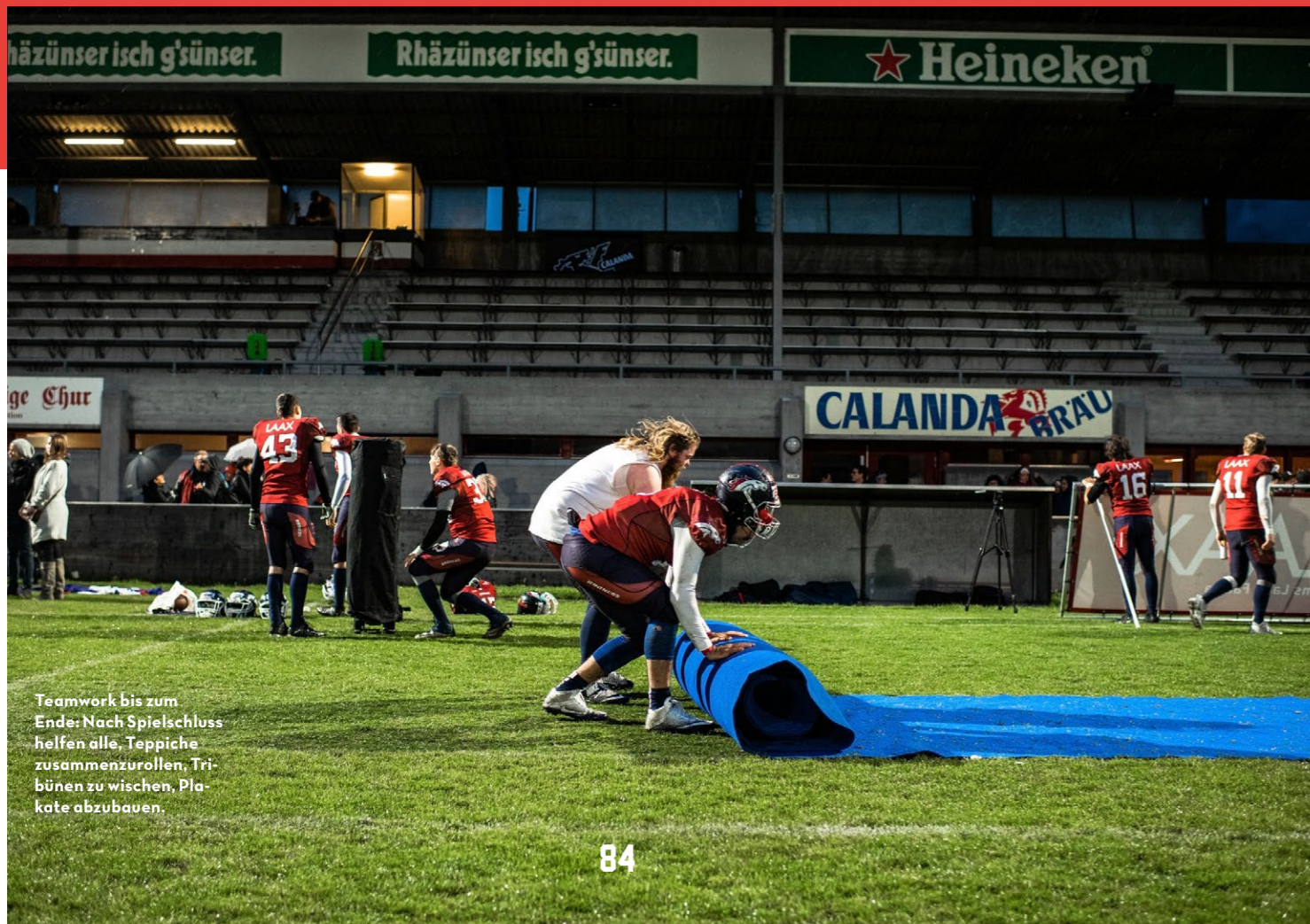
Teamwork bis zum Ende: Nach Spielschluss helfen alle, Teppiche zusammenzurollen, Tribünen zu wischen, Plakate abzubauen.