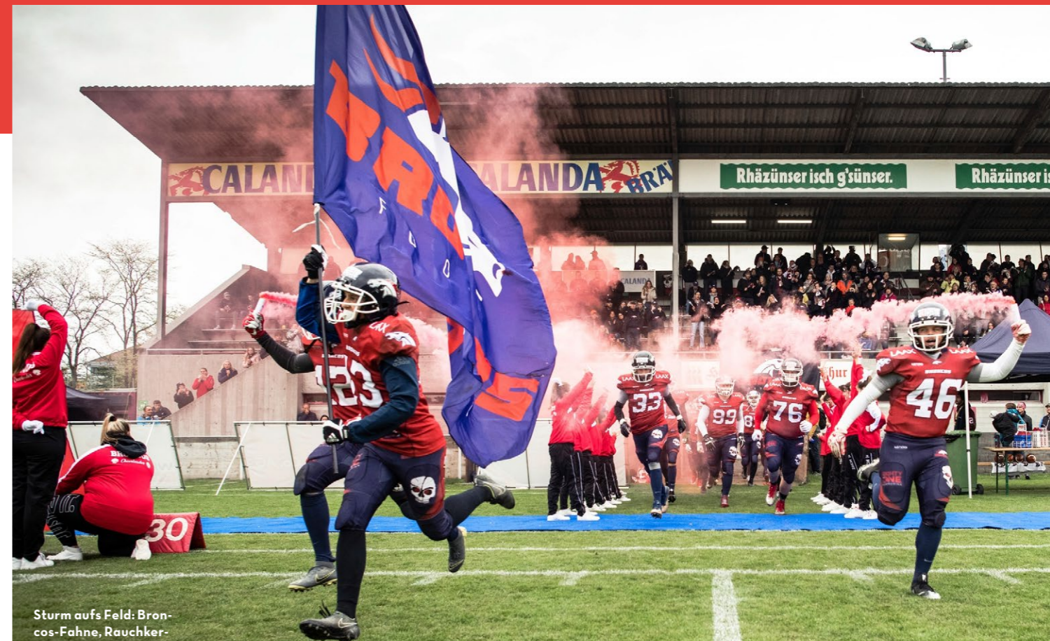
Sturm aufs Feld: Broncos-Fahne, Rauchkerzen, lauter Sound gehören im Stadion an der Ringstrasse in Chur zur Einstimmung.